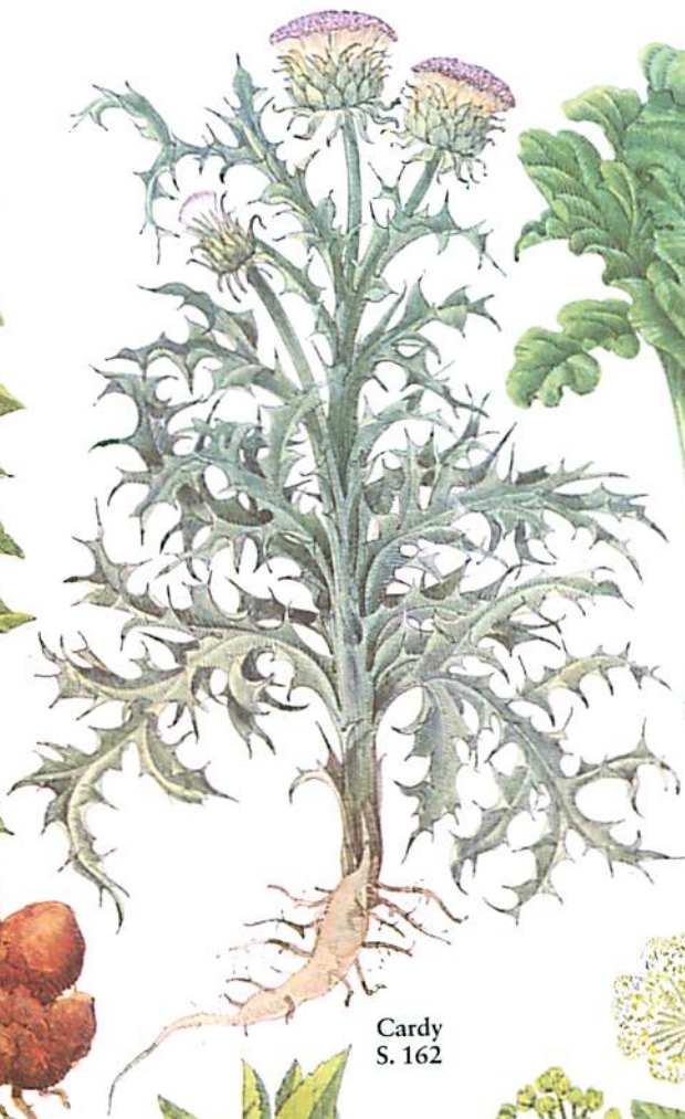
Cardy S. 162