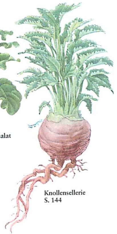
Knollensellerie S. 144