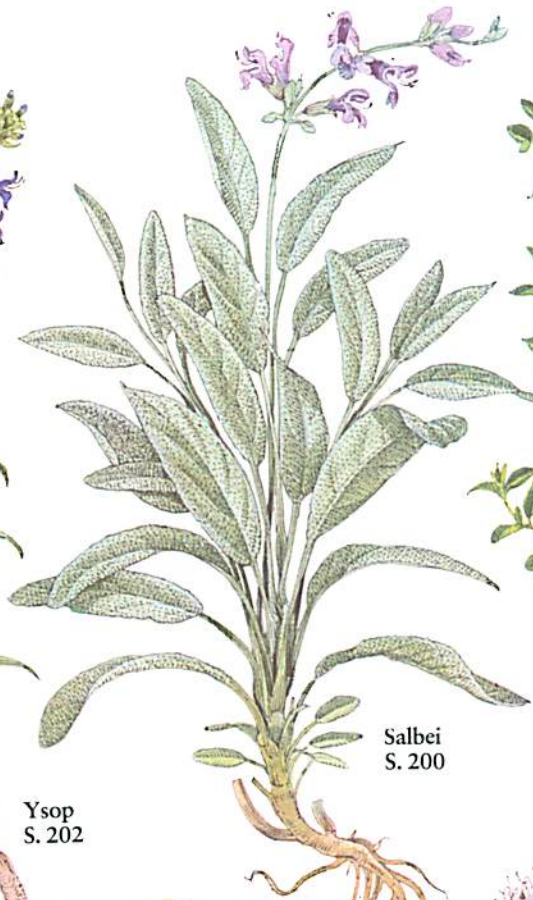
Salbei S. 200