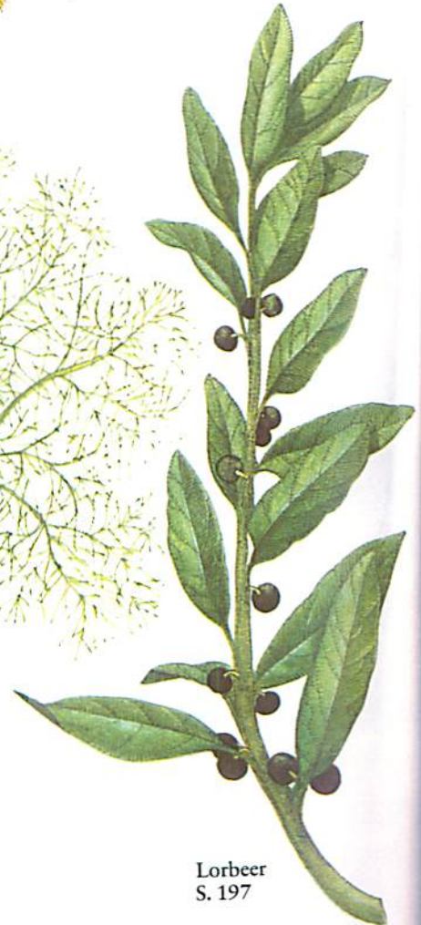
Lorbeer S. 197