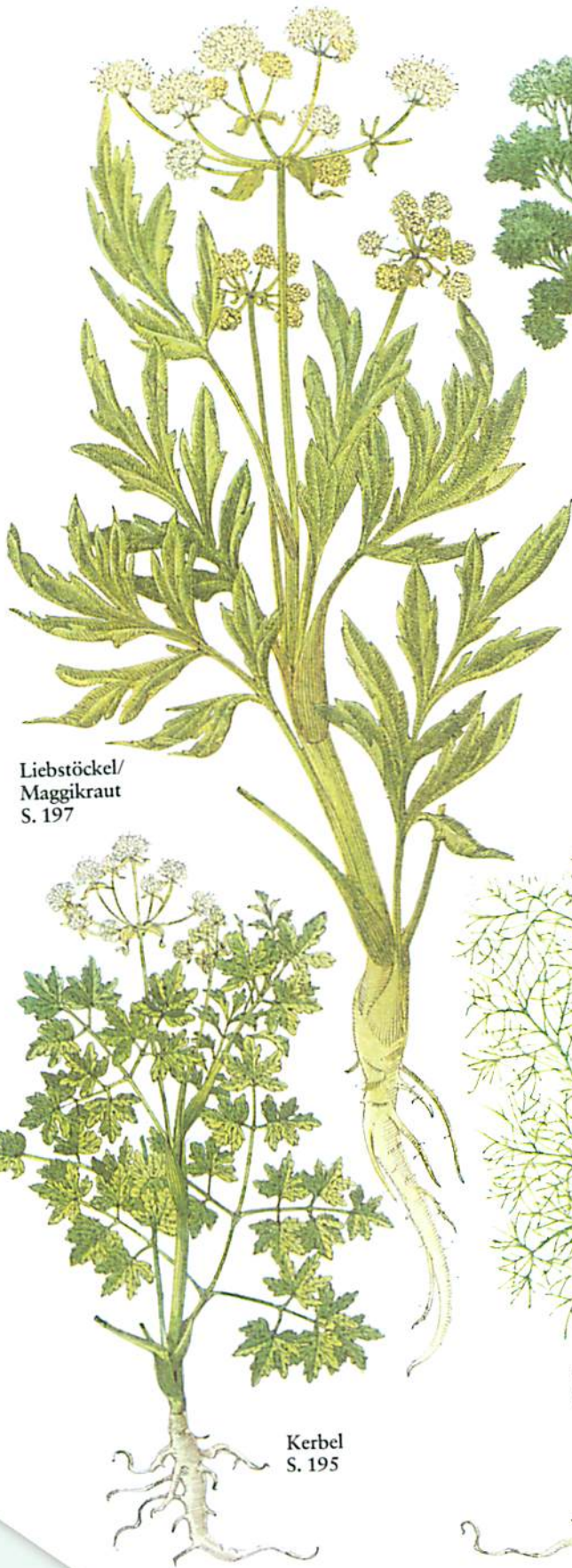
Liebstöckel/ Maggikraut S. 197