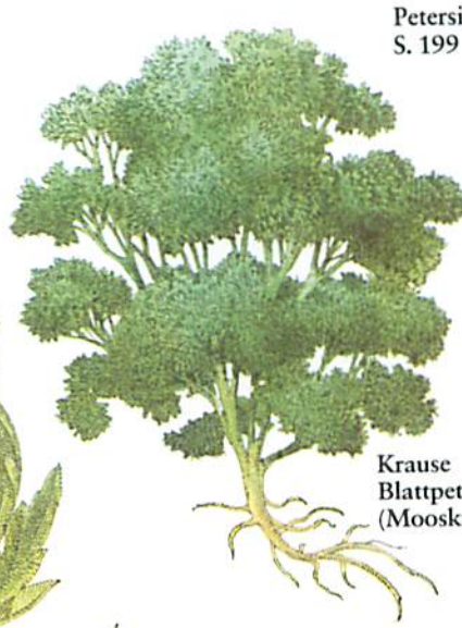
Krause Blattpetersilie (Mooskrause)