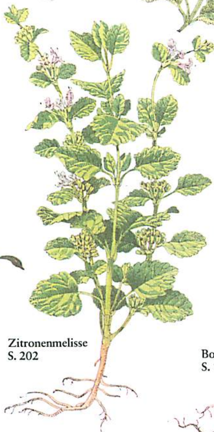
Zitronenmelisse S. 202