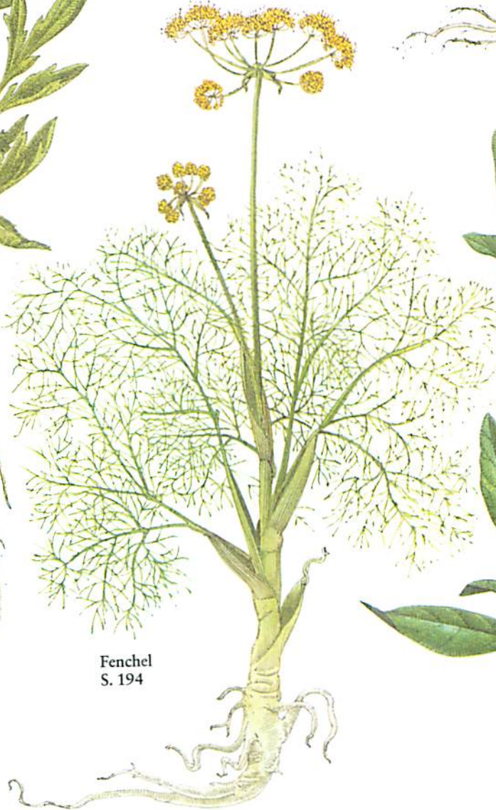
Fenchel S. 194