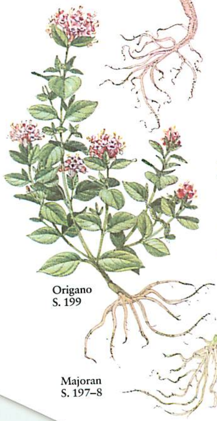
Origanum S. 199