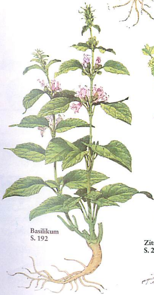
Basilikum S. 192