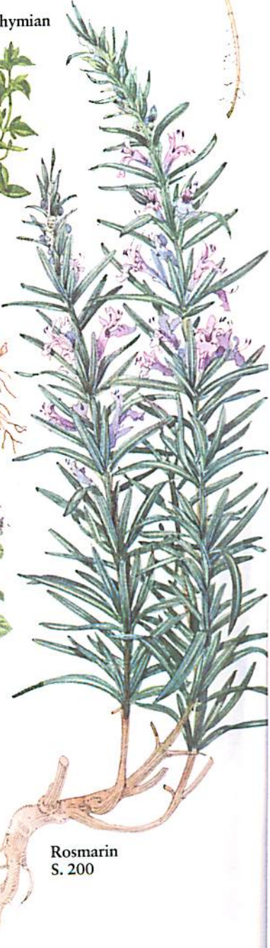
Rosmarin S. 200