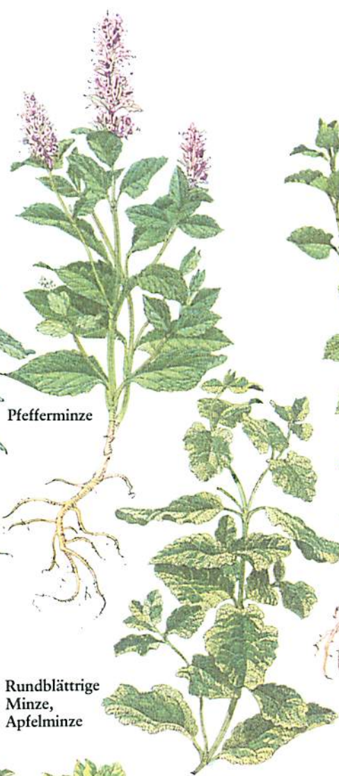
Rundblättrige Minze, Apfelminze