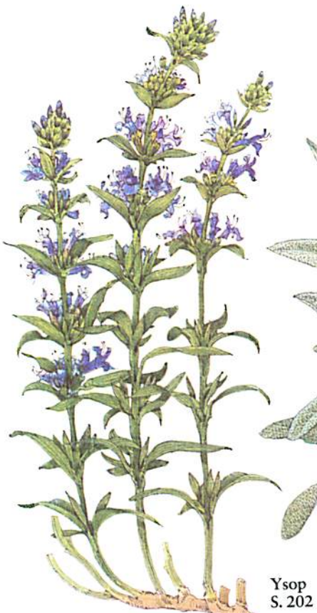
Ysop S. 202